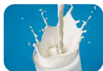
Leche Evaporada entera (15 latas)

Se ejecuta a través de los centros de salud de MINSA y EESALUD, proporcionando a los usuarios una canasta de alimentos en crudo, que constituye un complemento alimentario que contribuye con su recuperación integral.