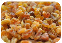
Papa seca (4Kg)