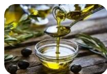
Aceite vegetal (1Lt)