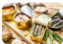
Pescado, enlatado en aceite (15 latasx 425g)