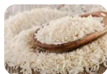
Arroz Pilado Superior (15 Kg)