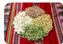
Lenteja, frijoles, arvejas(5Kg)