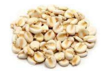
Maiz (5 Kg)